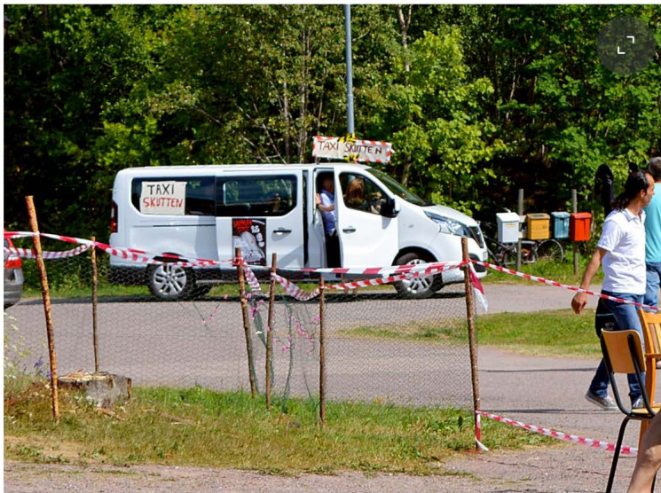
Skenstahyttan ligger på gränsen mellan Borlänge, Säter och Smedjebacken men långt ifrån allmänna kommunikationer. Därför ordnar arrangörerna gratistaxi för besökarna.

– Vi har förbättrat oss på flera punkter, till exempel så kommer vi att ha fler bilar och ett bättre system för gratistaxi från Ludvika, Borlänge och Säter.