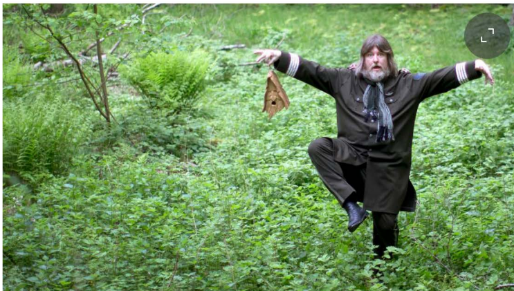
Ebbot kommer tillbaka till Skenstahyttan i sommar.

- Och vi är ändå säkra på att vi säljer slut på biljetterna. Folk har redan börjat köpa fastän vi inte gjort någon reklam mer än på hemsidan.