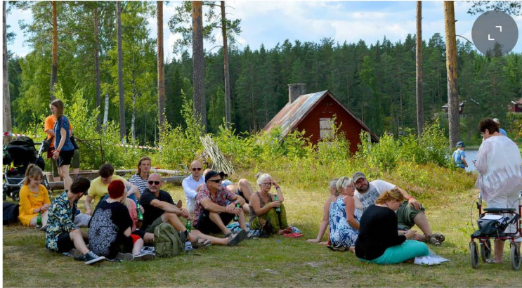
Årets slogan för festivalen är Ännu mer, ännu bättre men med samma kärlek.

- Jag tror att vi fortfarande är Sveriges billigaste festival med tanke på utbudet.